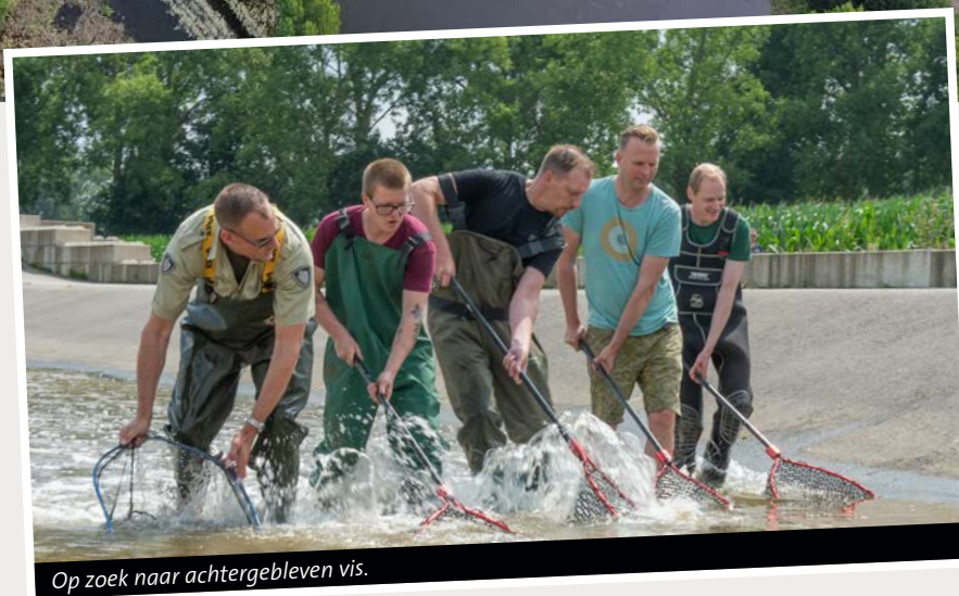
Op zoek naar achtergebleven vis.

H et opzetten en uitvoeren van een calamiteitenplan heeft heel wat voeten in de aarde, waarbij Sportvisserij Limburg het redden van vis uit benarde situaties centraal stelt. Nieuwe technische hulpmiddelen zijn daarbij onmisbaar en social media vormen een belangrijk wapen, zo bleek na de laatste overstroming. In de Facebookgroep SOS Limburgse Vissers die werd opgericht, bleven dagenlang meldingen binnenkomen. Drones bleken een uitstekend middel om gebieden in kaart te brengen en vis in nood op te sporen. Deze meldingen kwamen vaak ook weer bij SOS Limburgse vissers terecht en werden uiteindelijk digitaal verwerkt en gepubliceerd. Met het computerprogramma Arcgis kregen wate-