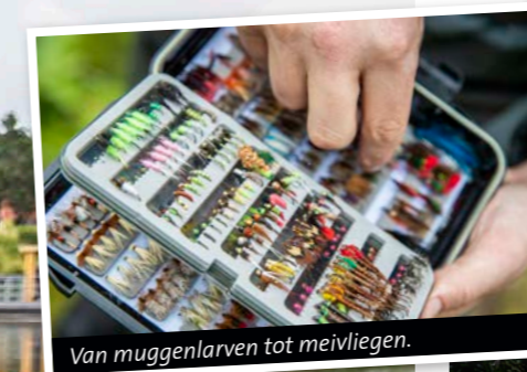
Van muggenlarven tot meivliegen.

TEKST: ANDRES DE ROUVILLE