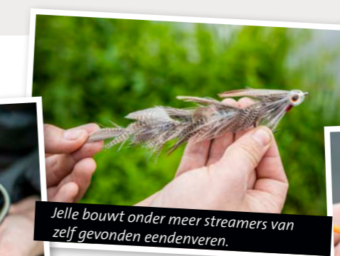
Jelle bouwt onder meer streamers van zelf gevonden eendenveren.