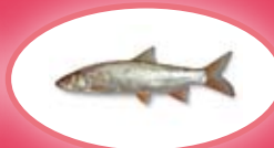
Sneep - 30 cm