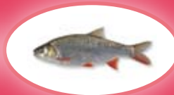
Winde - 30 cm