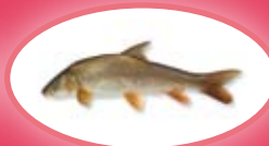
Barbeel - 30 cm