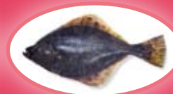
Bot - 20 cm