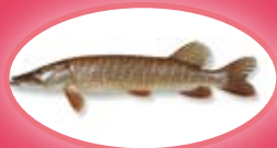
Snoek - 45 cm