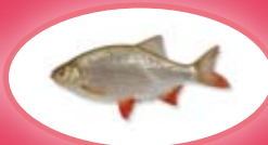
Riet-/ruisvoorn - 15 cm