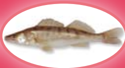
Snoekbaars - 42 cm