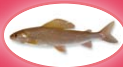
Vlagzalm - 35 cm