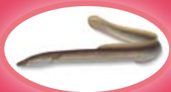
Paling - 28 cm