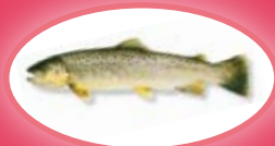
Forel* - 25 cm

* bron- beek- en regenboogforel en beekrider