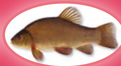
Zeelt - 25 cm