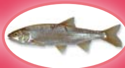
Serpeling - 15 cm