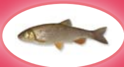
Kopvoorn - 30 cm

* bron- beek- en regenboogforel en beekrider