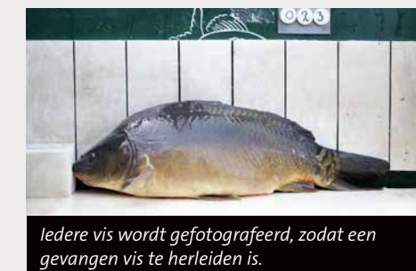
Iedere vis wordt gefotografeerd, zodat een gevangen vis te herleiden is.