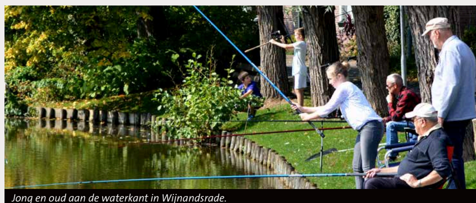
Long en oud aan de waterkant in Wijnandsrade.