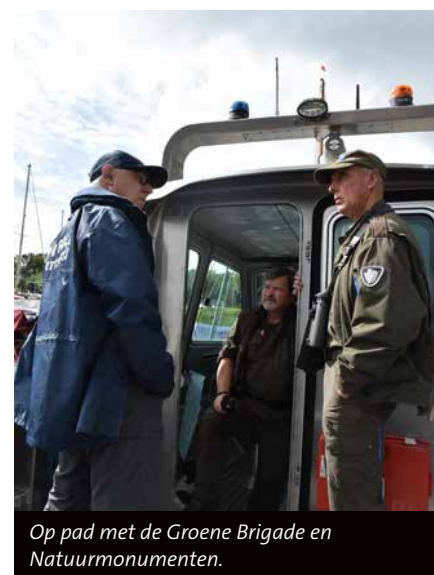
Op pad met de Groene Brigade en Natuurmonumenten.