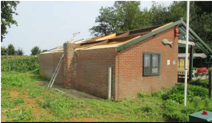
Dankzij de gemeente kon het dak van het clubgebouw worden gerepareerd.