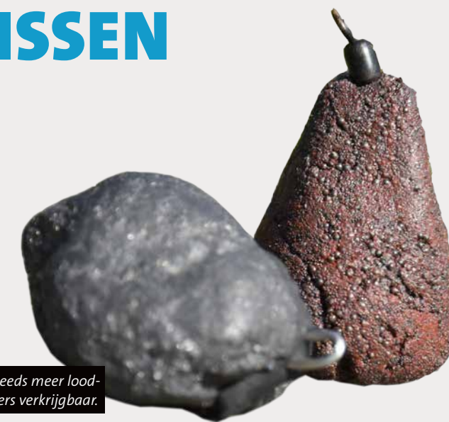
Er zijn steeds meer loodvervangers verkrijgbaar.

Eurotackle in Roermond en JD Floats in Melick helpen met het verkopen van de loodvrije materialen. In deze winkels vind je loodvrije voerkorven, wartellood en karperlood in verschillende gewichten. Deze zijn gemaakt op basis van in water biologisch af-