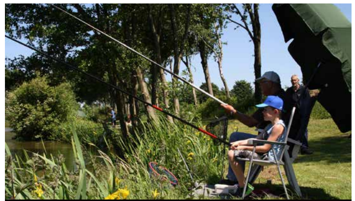
De vereniging kreeg subsidie voor het realiseren van veilige visplekken.

Op 21 maart 2018 zijn er weer gemeenteraadsverkiezingen. Dat lijkt nog ver weg, maar politieke partijen schrijven nu al hun verkiezingsprogramma's. Gemeentelijk beleid kan grote invloed hebben op het visplezier. Hoog tijd dus om alvast met je vereniging in actie te komen. HSV De Forel uit Reuver geeft het goede voorbeeld.