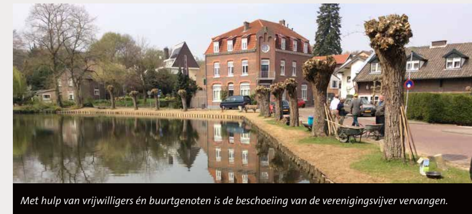
Met hulp van vrijwilligers én buurtgenoten is de beschoeiing van de verenigingsvijver vervangen.