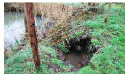
Op enkele verenigingswateren in Limburg huizen momenteel koppels bevers.

Sportvisserij Limburg zet ook sterk in op jeugd. Er wordt een uitgebreid activiteitenprogramma ontwikkeld dat moet leiden tot een toename van het aantal jeugdvissers. Binnen de wedstrijdvisserij wordt hier al op vooruitgelopen. Er loopt momenteel een uitgebreid programma met masterclasses. In 2017 wordt dit programma verder doorontwikkeld. Ook de opzet van de federatiewedstrijden wordt in een nieuw jasje gestoken. In samenwerking met de Projectgroep Wedstrijden wordt er een nieuwe weg ingeslagen om het wedstrijdvisseren op federatief niveau een impuls te geven.