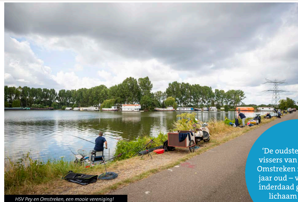
HSV Pey en Omstreken, een mooie vereniging!

'De oudste wedstrijdvisser van HSV Pey en Omstreken zijn 87 en 88 jaar oud – vissen is dus inderdaad gezond voor lichaam en geest'